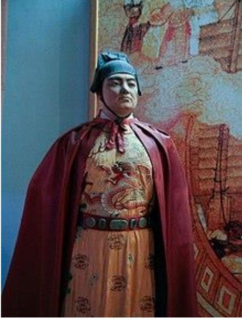
अॅडमिरल झेंग हे यांचा चीनमधील संग्रहालयातील मेणाचा पुतळा

या मुसलमानधर्मीय तृतीयपंथी व्यक्तीने केले. या समुद्र सफरींद्वारे चीनने हिंद महासागरातील