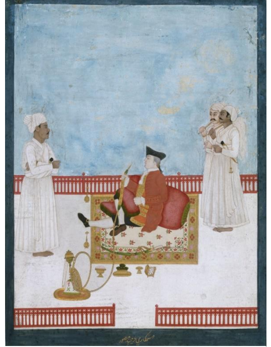
ब्रिटीश ईस्ट इंडिया कंपनीच्या अधिकाऱ्याचे अंदाजे १७६० मधील चित्र

डच व ब्रिटीश या दोघांच्याही राजाश्रयातून उभ्या राहिलेल्या, मजबूत लष्करी पाठबळ असलेल्या आणि आमिर-उमरावांची भरघोस आर्थिक गुंतवणूक असलेल्या 'ईस्ट इंडिया कंपनी' होत्या. हे जगातले पहिले आंतरराष्ट्रीय उद्योग होते. डचांनी दक्षिणपूर्व आशिया व इंडोनेशियातून पोर्तुगीजांची हकालपट्टी केली तर ब्रिटीशांनी भारतीय उपखंडातून. या साऱ्या घडामोडींमध्ये स्थानिक राजकारणात युरोपीयनांची ढवळाढवळ वाढत गेली. तरीही जवळजवळ १८व्या शतकापर्यंत ही सारी व्यापारी मोहीमच होती, त्यात युरोपीयन राजदरबारांचा राजकीय हस्तक्षेप नव्हता.