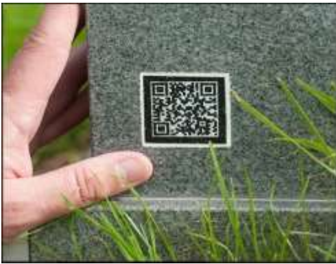
थडग्यावरील क्यूआर कोड

आणखी एक नवीन उपयोग म्हणजे मृत व्यक्तींची माहिती साठवण्यासाठी थडग्यांवर