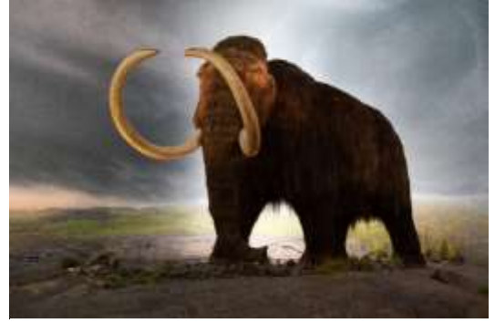
वूली मॅमथचे कल्पनाचित्र

भटक्या माणसांचे जगणे पूर्णतः निसर्गस्नेही होते, हा आणखी एक गोड गैरसमज आहे. माणसे आफ्रिकेतून बाहेर पडली त्यावेळी एकूण लोकसंख्या काही हजार असावी. हिमयुग संपले तेव्हा साधारण पन्नास लाख ते एक कोटी माणसे सर्व जगभरात मिळून होती, असा अंदाज आहे. इतक्या कमी लोकसंख्येच्या आणि सर्वत्र विखुरलेल्या या माणसांमुळेही काही भूभागांमधील निसर्गाचे रूप कायमस्वरूपी बदलले, तर काही प्राणी नामशेष झाले. उदा. ऑस्ट्रेलियातील आदिवासी मोठ्या परिसराला मुद्दाम आग लावून देत असत. यामुळे प्राण्यांची पळापळ होऊन मुबलक शिकार हाती लागत असे. जळून गेलेल्या परिसरात नव्याने उगवण झाली, की त्यातूनही खाण्यायोग्य मुबलक गोष्टी गोळा करून आणता येत असत. पण वारंवार लावलेल्या आगींमुळे त्या परिसंस्थेचे स्वरूप कायमचे बदलले. उत्तर अमेरिकेतील हिमाच्छादित भागात वावरणाऱ्या वूली मॅमथ ह्या हत्तीसदृश प्राण्याची प्रजाती भटक्या माणसांनी केलेल्या शिकारीमुळे पूर्णपणे नष्ट झाली. भटक्या जीवनातही मानवांनी केलेल्या निसर्गाच्या न्हासाची अशी अनेक उदाहरणे आहेत.