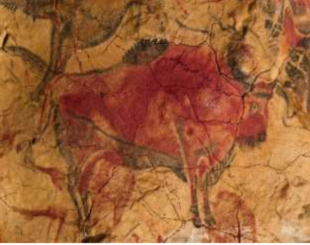
स्पेनमधील अल्टामिरा गुहेतील अश्मयुगीन चित्र (स्रोत - विकीपिडिया)

भटक्या लोकांचे जीवनविषयक तत्त्वज्ञान व श्रद्धा काय असाव्यात, याबाबत बरेच