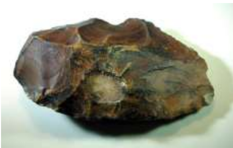
इजिप्तमध्ये सापडलेले दगडी हत्यार

होमो सेपियन मानवाने आफ्रिकेतून बाहेर पडून संपूर्ण पृथ्वीवर वसाहती केल्याच्या