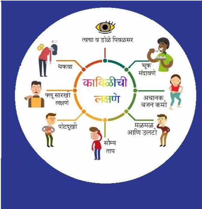
चित्र : काविळीची लक्षणे

सर्वोच्च न्यायालयापर्यंत जेव्हा एखादा खटला जातो त्यावेळी त्यामध्ये नक्कीच काहीतरी महत्त्वाच्या कायदेशीर बाबींचा उहापोह होणे अपेक्षित असते. या खटल्यातील विचाराधीन कायदेशीर बाबी होत्या; उत्पादनाबाबतची जबाबदारी (प्रॉडक्ट लायबिलिटी), उत्पादनाच्या गुणवत्तेबाबतची जबाबदारी व तिचा झालेला भंग (ब्रीच ऑफ वॉरंटी) व याबाबत एकंदरीत झालेला किंवा केलेला निष्काळजीपणा (निग्लिजन्स). आणि हो! हे