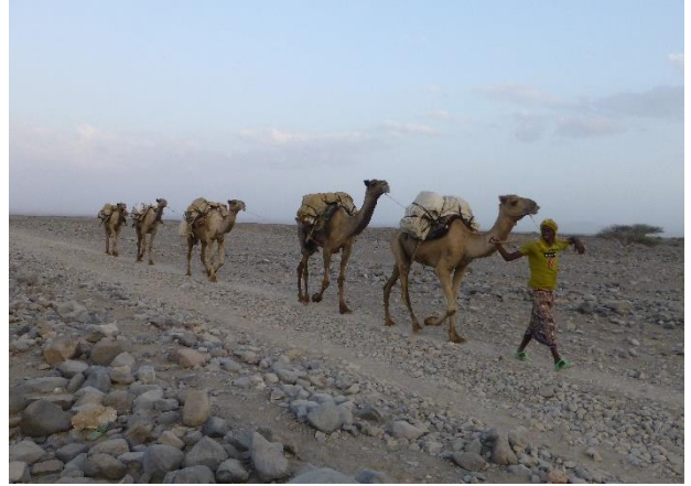
अफार वाळवंटात उंटांचा तांडा

माझ्याबरोबर आलेले मार्गदर्शक आणि उंट घेऊन आलेले लोक आता परत फिरणार. कारण युरोपियन वसाहती झाल्या, तेव्हा इथे देशाची सीमा बदलली. पण ती माझ्याबरोबर आलेल्या अफार लोकांना मान्य नाही... ते म्हणतात, हा आमचा देश आहे, आम्ही येतो पुढेही तुमच्याबरोबर. पण त्यांच्याकडे पासपोर्ट नाही, की काही आयकार्ड नाही. त्यांना परतच जावे लागणार.