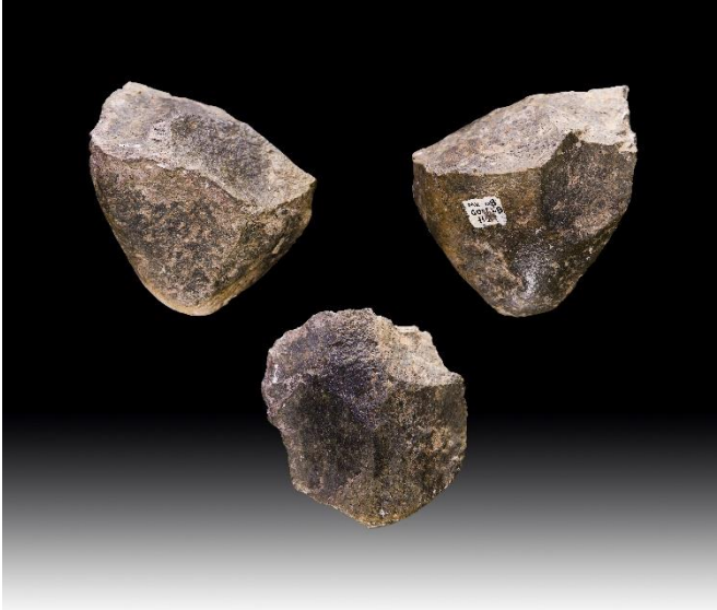
इथियोपियामध्ये सापडलेली अश्मयुगीन हत्यारे

तुम्ही जेव्हा तहानलेले असता, तेव्हा तुमचं जग बदलतं. ते आक्रसतं. त्याला खोली उरत नाही. सर्व बाजूंनी क्षितिज जवळ येतं. पृथ्वीच्या गोलावर आकाशाचं झाकण घट्ट बसतं. अगदी कठीण आणि गुळगुळीत असतं ते. वाळवंट तुमच्याभोवती गळफासासारखं आवळलं जातं. तहानलेला मेंदू सगळी अंतरं जवळ आणून कुठे पाणी आहे का ते तपासू लागतो. डोळ्याची भिंगं होतात. बाकी काही महत्त्वाचं नसतंच तेव्हा!